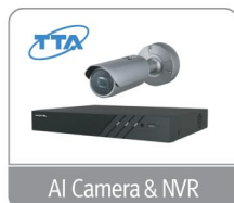
AI Camera & NVR