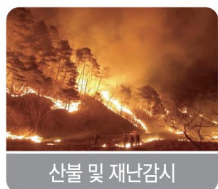
산불 및 재난감시