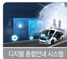
디지털 종합안내 시스템