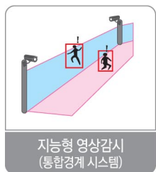
지능형 영상감시 (통합경계 시스템)